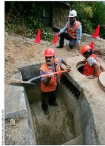
Ya se han aprobado recursos para intervenir durante este año 82 puntos, entre ellos Chiguayante (en la fotografía), en el Gran Concepción. Las obras totalizan una inversión de $700 millones.