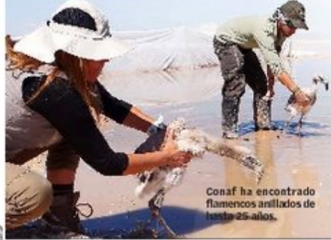
Conaf ha encontrado flamencos anillados de hasta 25 años.

El 29% (17.726) de los flamencos catastrados habita en la Región de Antofagasta, en la provincia de El Loa. En el Salar de Tara permanecen 10 mil ejemplares, siendo la zona más poblada de la II Región. El Salar de Tara está ubicado a 120 kilómetros al este de San Pedro de Atacama, a cuatro mil metros de altitud, y es parte de la Reserva Nacional Los Flamencos.